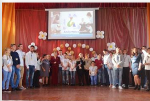
III РЕГИОНАЛЬНЫЙ ЭТАП, 10–12 октября 2018 г.