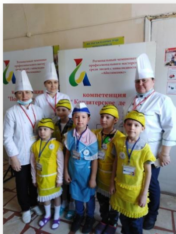
VI РЕГИОНАЛЬНЫЙ ЭТАП, 15–20 мая 2021 г.