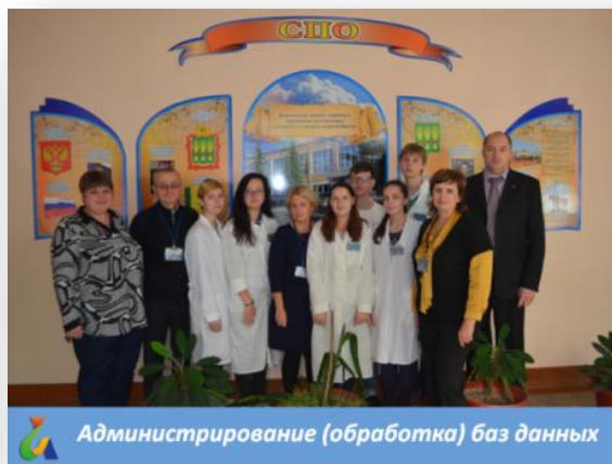
Администрирование (обработка) баз данных

I РЕГИОНАЛЬНЫЙ ЭТАП, 12–13 октября 2016 г.